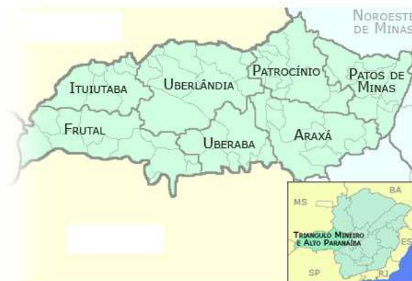
Figura 1.2: Mapa de Localização

consumidor de Minas Gerais e a cidade que mais cresce no Triângulo Mineiro, a sua economia se baseia nas agroindústrias que formaram na região um importante centro industrial, mas destaca-se na cidade o setor de serviços. Estão sediados na cidade, grandes atacadistas de atuação nacional e internacional, devido principalmente à sua localização geográfica na região central do Brasil. Cinco das maiores atacadistas do país são desta cidade, como Martins, Arcom, Peixoto, União e Aliança.